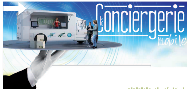
Le Camion de la conciergerie

Ce projet présentera de nombreuses caractéristiques d'un site de e-commerce, mais aura l'ambition d'aller bien au-delà grâce à ses propositions de valeur telles que : proximité, assistance à l'utilisation, support aux producteurs, distributeurs et prestataires de services locaux. Le caractère innovant réside bien dans cette offre multi-services accessible en multicanaux.