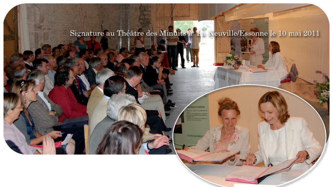
Signature au Théâtre des Minuits à La Neuville/Essonne le 10 mai 2011